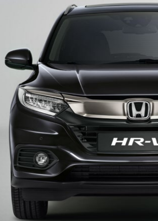
RUSE BLACK METALLIC