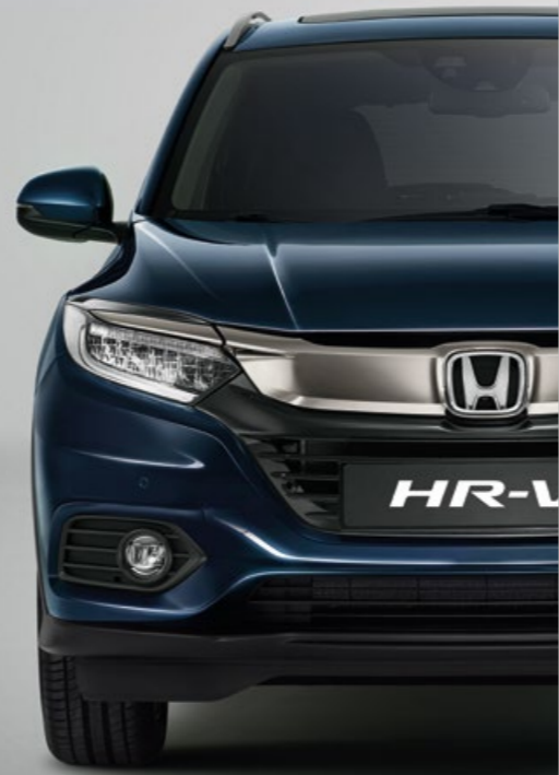
MIDNIGHT BLUE BEAM METALLIC

Színválaszték, ami nem csak jól hangzik, de nagyszerűen is néz ki. A Midnight Blue Beam Metallic-től a Platinum White Pearl-ig, széles választék várja, hogy megtalálja az egyéniségének tökéletesen megfelelőjét.