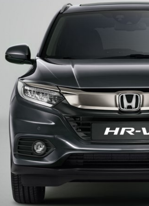
MODERN STEEL METALLIC